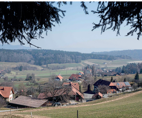
Das Dorf Schiltwald von Schweikhof aus gesehen.

Restaurant Sternen, Schmiedrued, 062 726 18 10, www.sternen-schmiedrued.ch Weberei- und Heimatmuseum Ruedertal, www.webereimuseum.ch