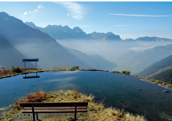
Gemütlicher Weitblick vom Spiegelsee auf der Fürenalp aus.

Erreichbar ist Engelberg mit dem Zug ab Luzern. Luftseilbahn Engelberg-Fürenalp, 041 637 20 94, www.fuerenalp.ch Luftseilbahn Stäfeli-Äbnetalp, 079 467 57 94