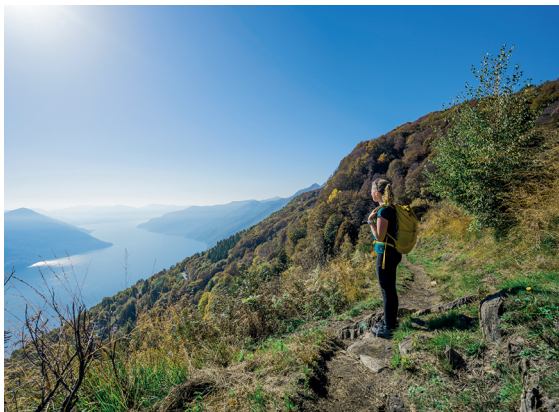
Der Abstieg startet gemächlich und mit einmaligen Aussichten.