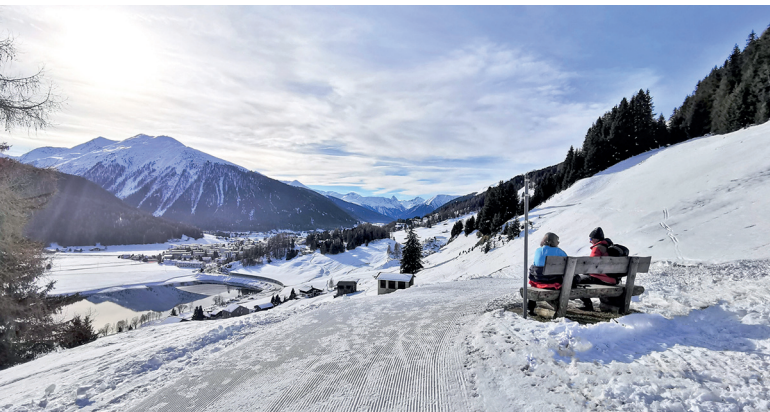
Rastplätzchen oberhalb Meierhof mit Aussicht zum Davosersee und zum Jakobshorn.

Kesslers Kulm-Hotel, Davos Wolfgang, 081 417 07 07, www.kesslerskulm.ch Restaurant Seehof, Davos Dorf, 081 417 94 44, www.seehofdavos.ch