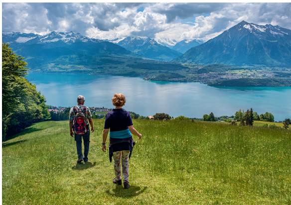
Ein Blick zurück lohnt sich: tolle Aussicht vom Margel auf Thunersee, Niesen und die Berner Alpen.