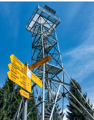
Der Aussichtsturm auf der Blueme.

Selbstbedienungsrestaurant «malZeit» im Reha Zentrum Heiligenschwendli, täglich geöffnet.