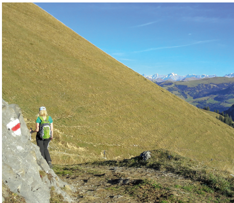
Während des Abstiegs geniesst man weiterhin tolle Rundsicht – im Hintergrund Eiger, Mönch und Jungfrau.