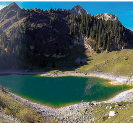
Blick auf den Walopsee, welcher insbesondere im Herbst interessante Farbtöne aufweist.

Erreichbar ist Reidenbach mit dem Bus ab Boltigen Bahnhof.