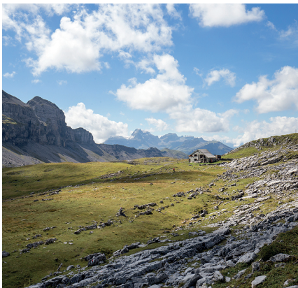
Auf der Tour quert man die Alp Erigsmatt und die Charetalp.