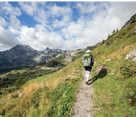
Aufstieg vom Gumen Richtung Bützi. Der mächtige Berg links ist der Ortstock.

Berggasthaus Gumen, 055 643 13 24, www.gumen.ch Berggasthaus Glattalp, 041 830 12 04, www.berggasthaus-glattalp.com SAC-Hütte Glattalp, 041 830 19 39, www.glattalpuette.ch Auf der Charetalp Verkauf von Schaf- und Ziegenkäse