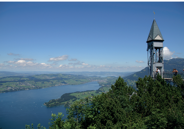
Der Hammetschwand-Lift trägt die Passagiere in 50 Sekunden auf die Hammetschwand.

Standseilbahn Kehrsiten-Bürgenstock und Bürgenstock Resort, www.buergenstock.ch