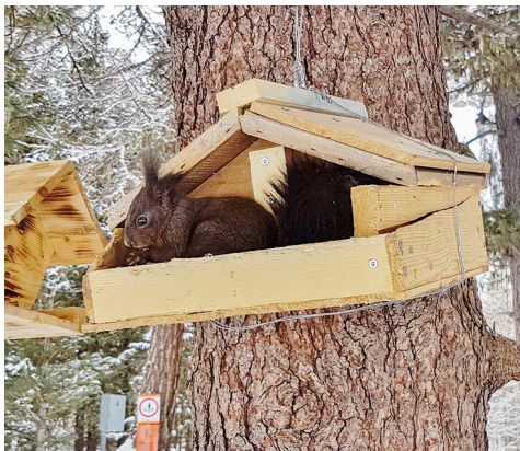
Wer etwas Zeit und Geduld hat, kann hier viele Tiere beobachten.