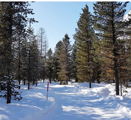
Bis auf die Kutschen ist der Winterwanderweg verkehrsfrei.

Erreichbar ist Pontresina verkehren mit den Zügen der Rhätischen Bahn RhB. Ins Val Roseg verkehren täglich Pferde-Omnibusse und private Pferdekutschen. Einfache Fahrt Erwachsene 20 CHF / Kinder 4-12J 10 CHF www.engadin-kutschen.ch