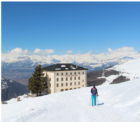
Eine wohlverdiente Rast auf der Sonnenterrasse des Hotels Weissshorn kommt gelegen.