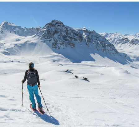
Diese Aussicht: man wähnt sich auf einem anderen Planeten.

Hôtel Weissshorn, 027 475 11 06, www.weissshorn.ch