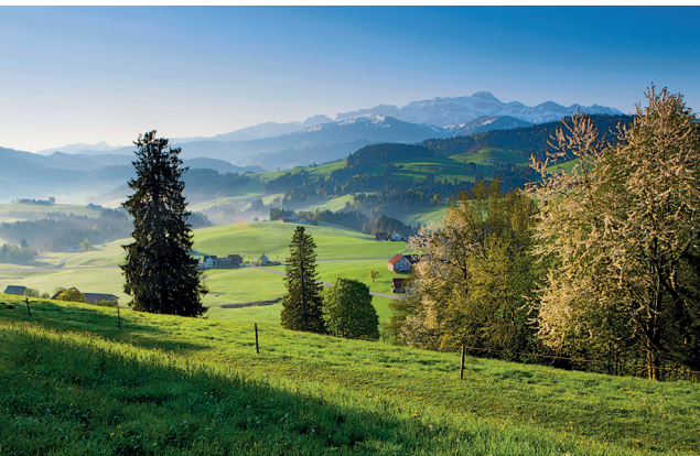
Wohltuende Weite mit Blick zum Säntis im Appenzellerland.

Erreichbar ist die Schwägälp mit dem Bus ab Nesslau.