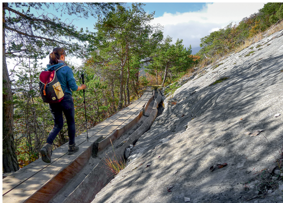
Genuss Sounenweg: Fast horizontal den Höhenlinien folgen.