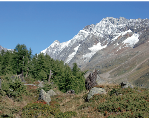
Auf dem Löttschberg-Panoramaweg mit Blick aufs Schinhorn.

Löttschental Tourismus, 027 938 88 88, www.loetschental.ch Hotel Fafleralp, 027 939 14 51, www.fafleralp.ch