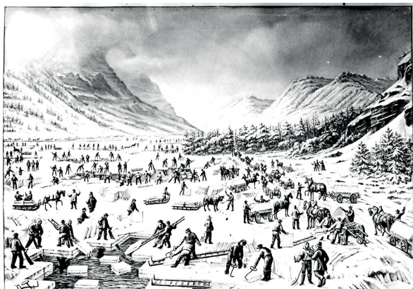
Die vergangene Erfolgsgeschichte: Arbeiter bauen um circa 1900 zentnerweise Eis ab.