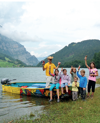
Der heutige «Glacemaa».

Hotel-Restaurant Rhodannenberg, 055 650 16 00, www.rhodannenberg.ch Gasthaus Im Plätz Klöntal, 055 640 13 74