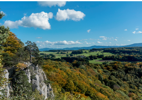
Die Wanderung verspricht gleich mehrere Aussichtspunkte mit tollen Ausblicken ins Baselbiet.

Restaurant Schönmatte, 061 701 53 88, www.restaurant-schoenmatt.ch Bärgbeiz Gempenturm, 061 701 51 50, www.gempenturm.com Hotel Bienenberg, 061 906 78 00,