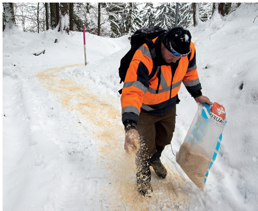
Im steilen Waldabschnitt wird der Weg bei Bedarf mit Sägemehl präpariert.