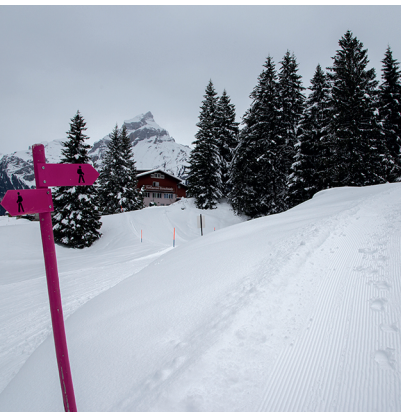
Auf der Gerschnialp verlaufen Skipiste und Winterwanderweg nebeneinander.

Restaurant Untertrüebsee, 041 637 12 26, 041 637 12 26, www.untertruebsee.ch www.weltcup-engelberg.ch