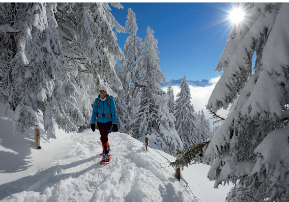
Verschneite Stille auf der Rigi Scheidegg.

Berggasthaus Rigi Scheidegg, 041 828 14 75, www.rigi-scheidegg.ch