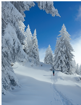
Die Schneeschuhwanderung führt über die Gersaueralp.