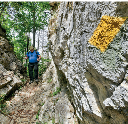
Eine Schneise im Malmkalk ermöglicht den Übergang vom Geitenberg zum Passwang.

Bergrestaurant Meltingerberg, 061 791 03 04 Berggasthof Stierenberg, 061 791 13 19,