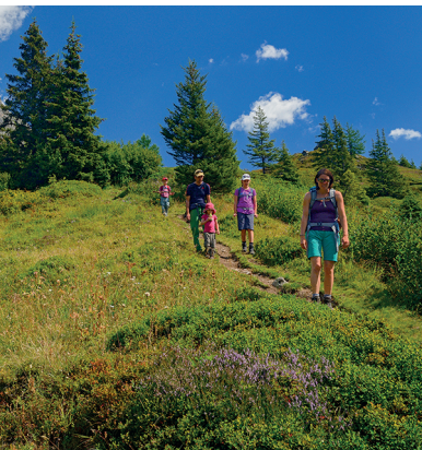
Naher der Sellflue werden die Tannen spärlich, dann auch die Heidelbeeren.

Sewenhütte, 041 885 18 72, www.sewenhuette.ch