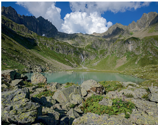
Das Seelein auf der Seewenalp lädt zum Verweilen ein.