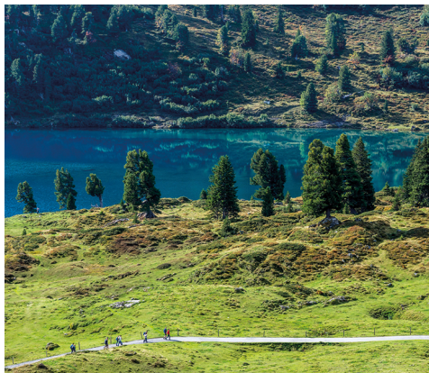
Der Engstlensee ganz in Türkis.