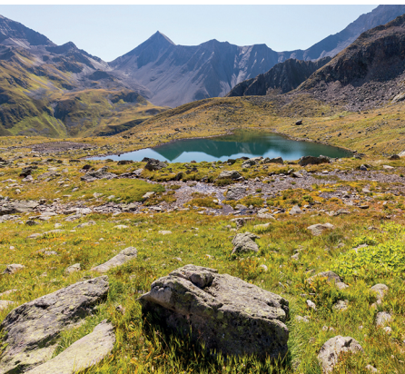
Rast beim Bergsee Murtel da Lai, bevor der grosse Aufstieg beginnt.

Berghaus Piz Kesch im Val Tuors, 081 407 11 93, www.val-tuors.ch