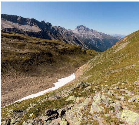
Einsam und wild, das oberste Val Tisch. Ganz vorne im Tal beginnt der Tischbach.