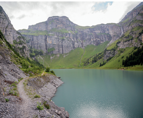
Der Weg führt am See entlang.

Restaurant Pension Alpina, Pigniu, 079 620 12 16, www.alpina-restaurant-pigniu.ch