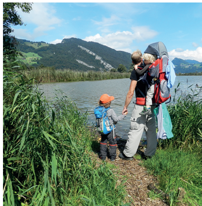
Das Städerried am Alpachersee ist ein Paradies für kleine und grosse Besucher.