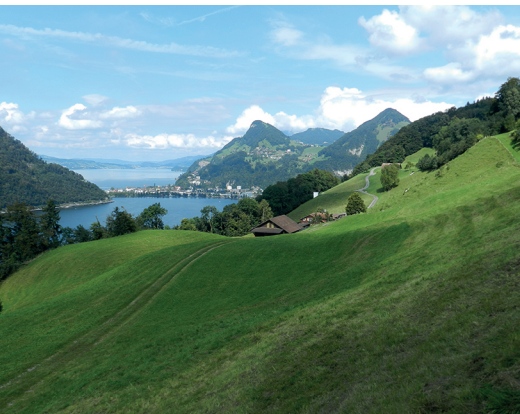
Der Blick fällt über den Alpachersee auf den Vierwaldstättersee.

Badi-Beizli, Alpnachstad, 041 670 13 79 Restaurant Aiola al Porto, Stansstad, 041 610 79 07, www.al-porto.ch Restaurant Chalet Alpnachstad, 041 329 12 00 Restaurant Hotel Rössli Stansstad, 041 619 15 15, www.roessli-stansstad.ch