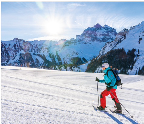
Die leichte Tour ist besonders für Kinder und Anfänger geeignet.