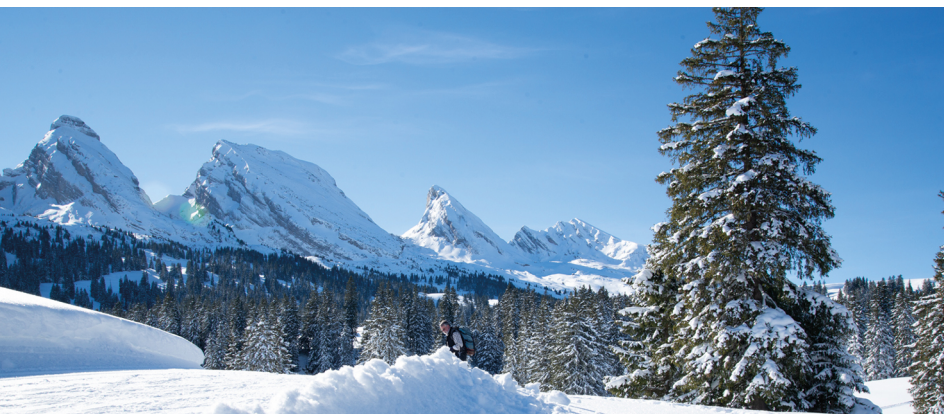
Winterparadies Selamatt.

Zinggen Pub, 071 999 13 30, toggenburg.swiss