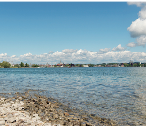
Von Weitem schon ist Konstanz mit seinem Riesenrad zu sehen.

Hotels und Restaurants in Kreuzlingen und Konstanz.