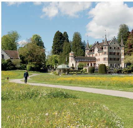
Der Seeburgpark in Kreuzlingen ist die grösste öffentliche Parkanlage am Bodensee.