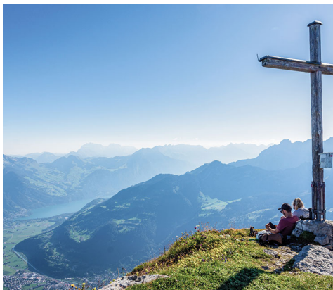
Gipfelfreuden auf dem Rautispiz.