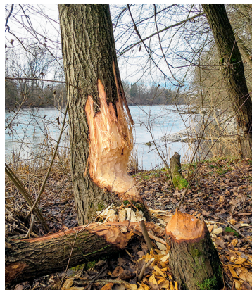
Hier waren Biber am Werk.