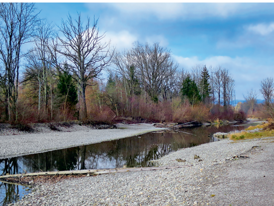
Prachtvolle Auenlandschaft in der Hunzigenau

Erreichbar ist Münsingen mit der S-Bahn ab Bern. Vom Tierpark Dählhölzli verkehren Busse zum Bahnhof Bern. Tierpark Dählhölzli, 031 357 15 15, www.tierpark-bern.ch