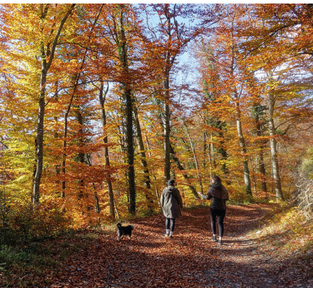
1001 Orangenuancen.