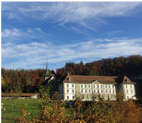
Die Abtei ist ein Besuch wert.