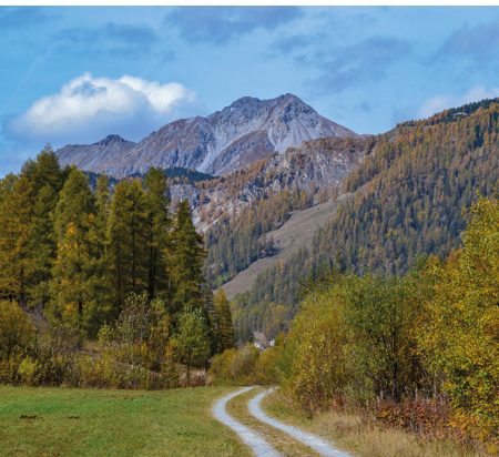
Unterwegs zwischen Tschierw und Fuldera.

Hotel Ofenpass, Tel. 081 858 51 82, www.ofenpass.ch