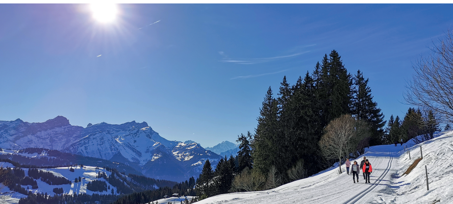
Bis zum Mont Blanc (in der Bildmitte) weitet sich die Sicht im zweiten Teil der Wanderung.

Buvette de la Verneyre, Villars-sur-Ollon, 079 732 32 17 Restaurant du Golf de Villars, 024 495 78 37, www.golf-villars.ch