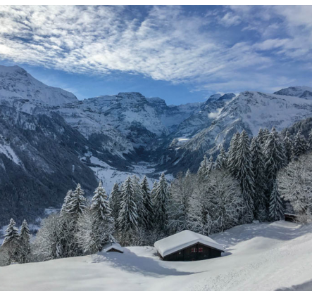
Aussicht in die Glarner Alpen.

Erreichbar ist Grotzenbühl mit der Gondelbahn von Braunwald. Bei Lawinengefahr ist die Galerie geschlossen. Beachten Sie die Angaben von Braunwald Tourismus: www.braunwald.ch