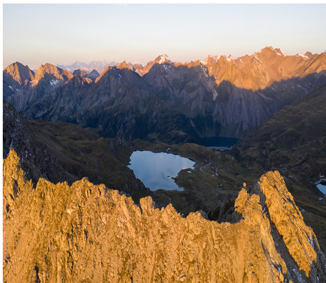
Blick auf den Lago Castel und den Lago di Morasco im Hintergrund.