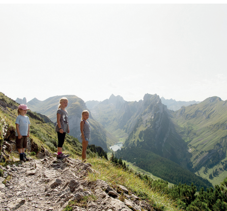
Der Weg ist breit und eignet sich gut für Kinder. Im Hintergrund der Fählensee.

Erreichbar ist «Brülisau, Kastenbahn» mit dem Bus über Weissbad. Dieses ist mit dem Zug mit Gossau und Wasserauen verbunden. Drehrestaurant Hoher Kasten, 071 799 11 17, www.hoherkasten.ch Gasthaus Staubern, 081 757 24 24, www.staubern.ch Gasthaus Bollenwees, 071 799 11 70, www.bollenwees.ch Gasthaus Ruhesitz, 071 799 11 67 www.ruhesitz.ch