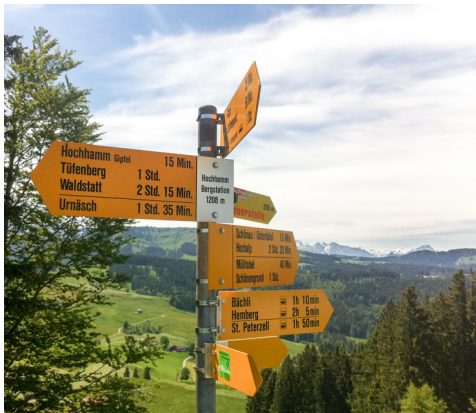
Bilder: Maria Zachariadis