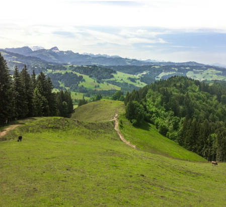
Steile Waldstücke wechseln sich mit Wiesenabschnitten ab.

Berggasthaus Hochhamm, 071 364 18 09. Am Wochenende immer und unter der Woche nur bei schönem Wetter offen.