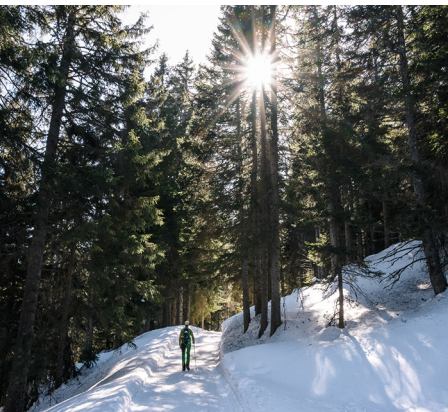
Auf dem Weg nach Spoina weiter talwärts.

Erreichbar ist Lenzerheide/Lai, Post mit dem Postauto ab Chur Bahnhof. Berghotel Tgantieni, 081 384 12 86, www.tgantieni.ch Lenzerheide Bergbahnen, 081 385 50 00, www.arosalenzerheide.com Bergbeizli Spoina, 081 384 26 77