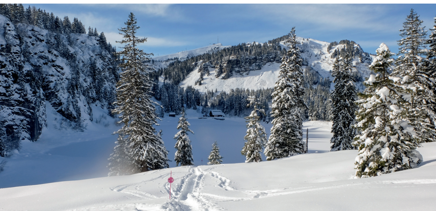
Der Lac des Chavonnes. Im Winter eine eisige Perle in den Waadtländer Alpen.

Hôtel-Restaurant du Lac, 024 495 21 92, www.bretaye.ch