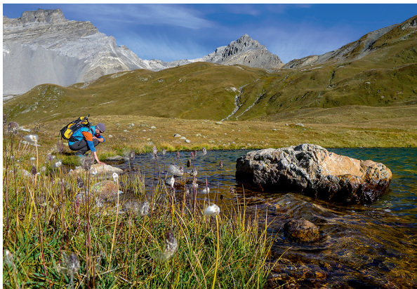
Temperaturcheck? Innehalten am Lai da Ravais-ch-Sur.