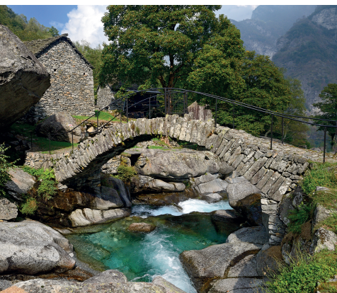
Tessiner Idylle in Puntid.

Grotto «La Froda» in Foroglio, 091 754 11 81, www.lafroda.ch