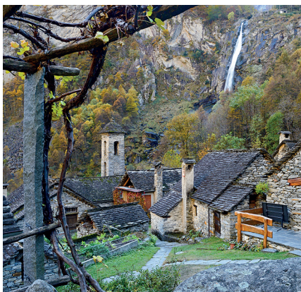
In Foroglio beginnt die Wanderung; im Zickzack arbeitet man sich in die Nähe des Wasserfalls hinauf.