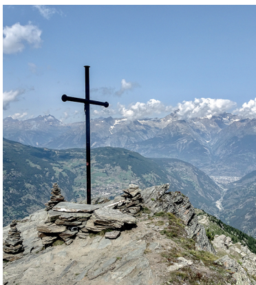
Auf dem Gipfel des Wannehorns.