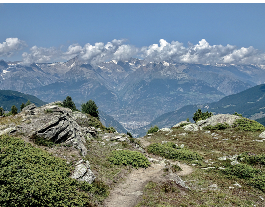
Blick auf Visp und das Tal.

Familien-Bergrestaurant Hannigalp, 027 955 60 20, www.graechen.ch