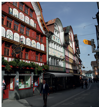
Aufgemalte Heilkräuter bei der Löwen-Drogerie in Appenzell.