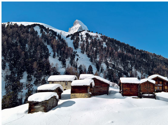
Beim Dörfchen Zmutt ist noch immer ein Zipfel des Matterhorns zu sehen.