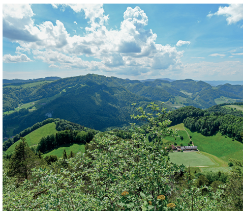
Vue sur le sud-ouest depuis le Hirnichopf.