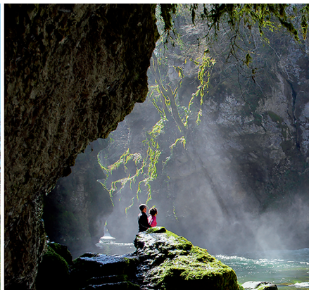
A gauche: le fier château de La Sarraz abrite aujourd'hui un musée. A droite: la spectaculaire cascade de la Tine de Conflens.