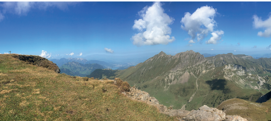
Un panorama impérial! Le sommet du Chaiserstuel est large et se prête bien à la pause pique-nique.

Restaurant Kreuzhütte, 041 628 23 09, www.berghof.ch