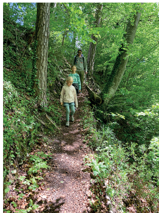
Une descente courte mais raide, et voici déjà l'abbaye d'Hauterive.