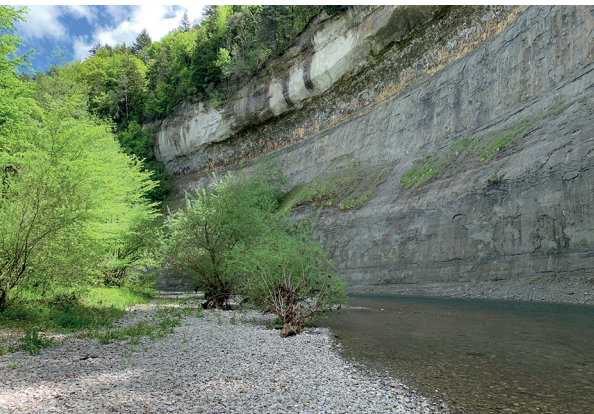
Les imposantes falaises de grès surplombant la Sarine sont un constant objet de ravissement.