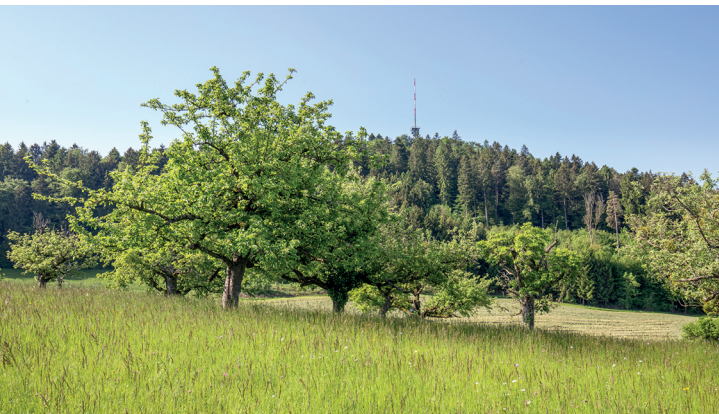
Vue sur la tour d'Irchel lors de la montée depuis Buch am Irchel.

Station de rapaces de Berg am Irchel, 052 318 14 27, www.greifvogelstation.ch