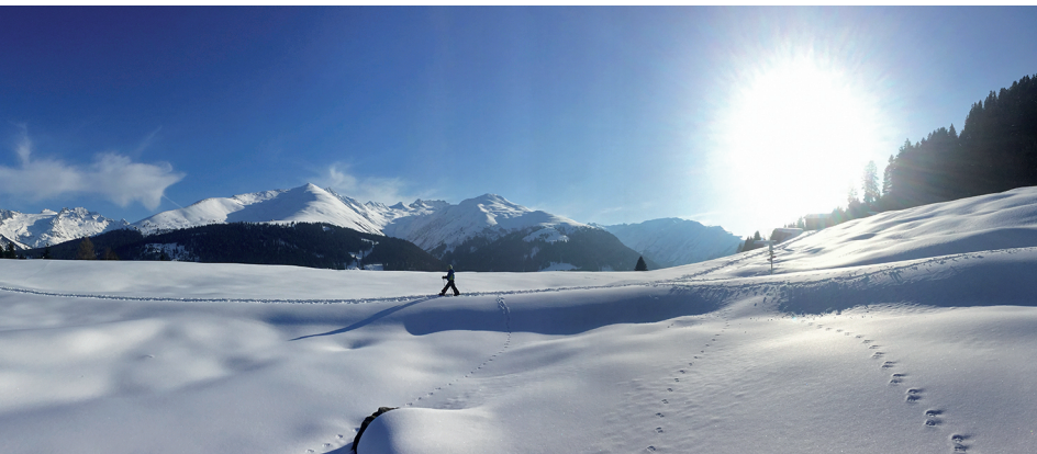
Un monde en soi: belle ambiance paisible sur l'Alp Prau Sura.

Restaurant Ustria Cresta Segnas, 081 947 41 76