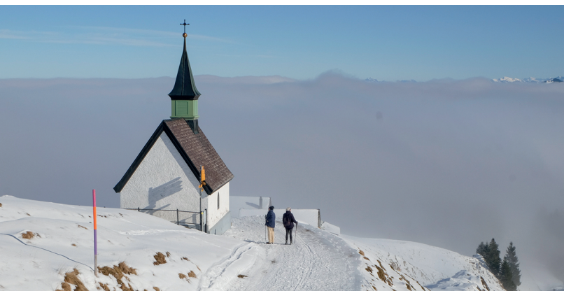
Toujours sur la crête mais bientôt dans le brouillard. À 1434 mètres, près de la chapelle St. Jakob érigée en 1859.

Hotel Jakobsbad, 071 794 12 33 www.hotel-jakobsbad.ch