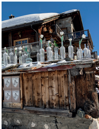
Chez Vrony, les bouteilles ont un autre usage.